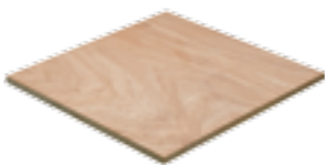
Fepcopy BB/CC WBP

Nous fournissons aussi des panneaux dont les deux faces sont lisses grâce à un film phénolique brun foncé. Ces panneaux sont couramment utilisés pour les coffrages béton. Pour la construction carrosserie, il existe un panneau avec un côté revêtu d'un profil antidérapant et l'autre côté d'un film lisse. Des certificats qui garantissent l'origine légale du bois sont disponibles, tels que le VOL (verification de l'origine légale) et FSC.