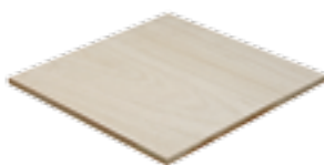
Fepcopy BB/CC MR