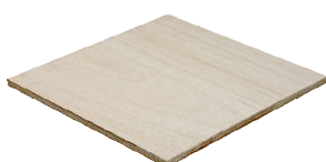
Fepcopy BB/CC MR