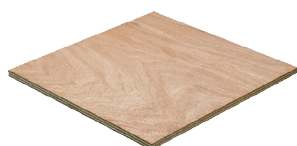
Fepcopy BB/CC WBP

Deze plaat is ook verkrijgbaar met aan 2-zijden een gladde donkerbruine fenol film t.b.v. betonbekistingen. Voor de carrosseriebouw voorziet men deze plaat aan 1-zijde van een antislipprofiel en aan de achterzijde van een gladde film. Er zijn certificaten beschikbaar die de legale herkomst van de grondstoffen garanderen, zoals VLO (Verified Legal Origin) en FSC.